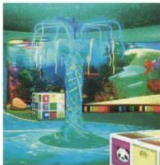
Un'opera della mostra "Nikolart"